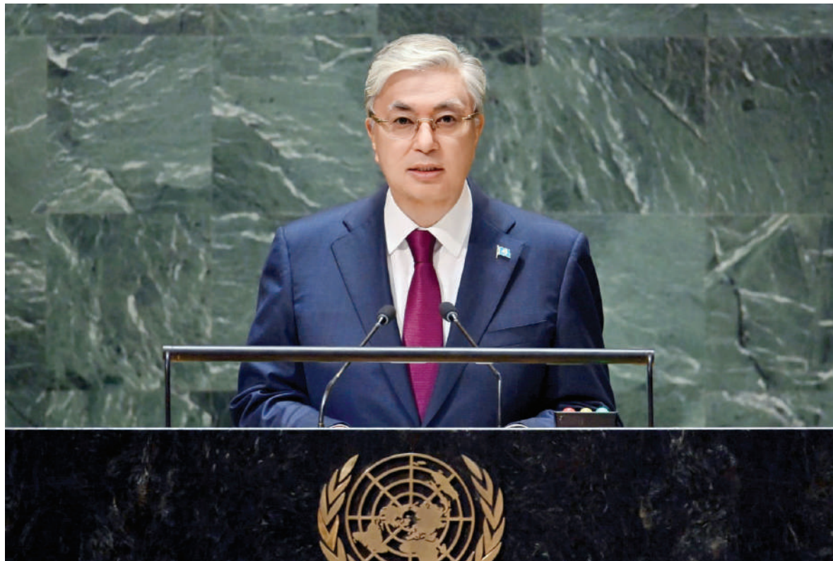
Мемлекет басшысы Нью-Йорк қаласына сапарында БҰҰ Бас Ассамблеясының 78-сессиясы аясында өткен Жалпы дебатқа қатысты.

Ең биік халықаралық мінберде сөз алған Қазақстан Президенті адамзат баласы бұрын-соңды басынан өткермеген аса үлкен сын-қатерлермен бетпе-бет келіп отырғанын және геосаяси қақтығыстардың жана кезеңіне өткенін мәлімдеді.